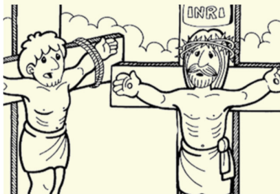
Leia Lc 23,33-43 e medite sobre as palavras de Jesus na cruz

Os reis deste mundo, muitas vezes, enganam, e Jesus sempre fala a verdade, dizendo que somos todos iguais, amados e filhos de um único Pai Amoroso. Temos o mesmo sol, o mesmo ar, o mesmo céu. A diferença está em quem deixa Jesus agir em sua vida e quem deixa Jesus agir menos. A proximidade com Deus se constrói com fé, oração e doação!