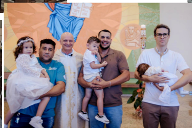
Batizados - 19/10