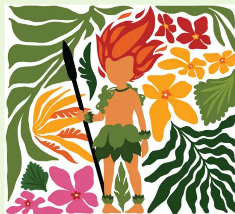
Curupira, figura do folclore brasileiro, guardião da floresta, é o mascote da COP 30.