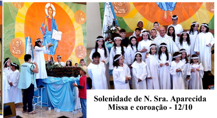
Solenidade de N. Sra. Aparecida Missa e coroação - 12/10