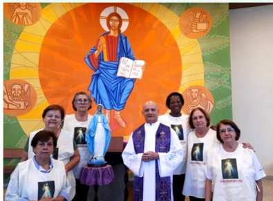
Terço pelos falecidos

Diante da morte, nossa paróquia se solidariza com a dor da família enlutada através da presença e orações da Pastoral da Esperança. Ao oferecermos consolo e apoio, somos sinais da presença de Cristo. Se você se sente tocado com o sofrimento do irmão e deseja levar a ele a esperança da ressurreição, junte-se a nós para trilharmos o caminho da salvação. Sejamos sinais de esperança no coração do mundo!