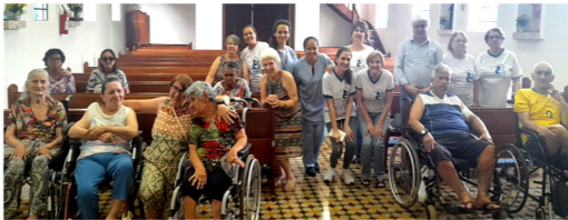
Dia do Idoso: Visita ao Cantinho Fraterno e Missa com bênção aos idosos