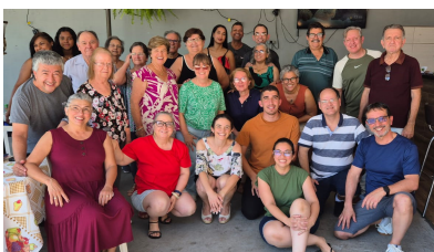
Conf. Past. Vocacional - 05/10