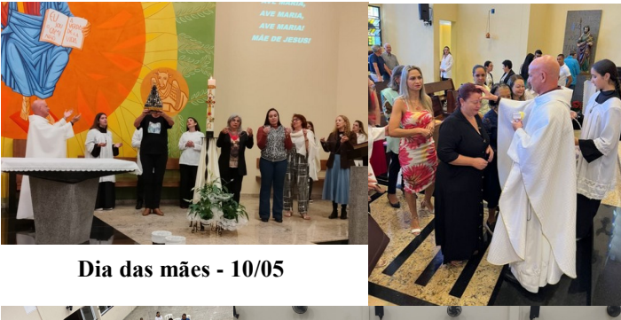
Dia das mães - 10/05