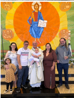
Batizado - 17/05