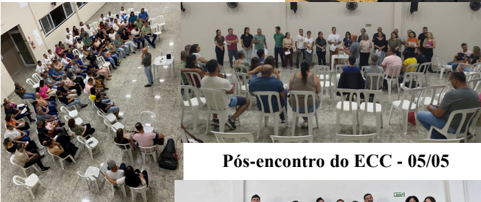
Pós-encontro do ECC - 05/05